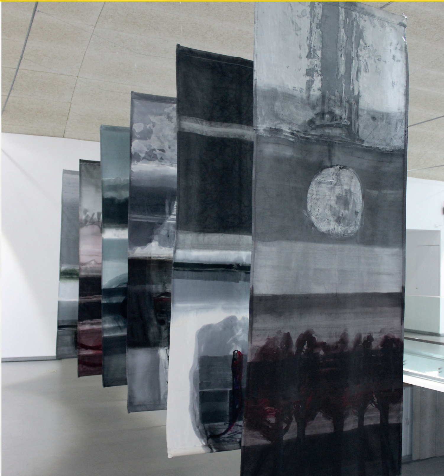
HENRIQUE DO VALE Sem título, 2014 Acrílico sobre tela. (6) 230x84cm