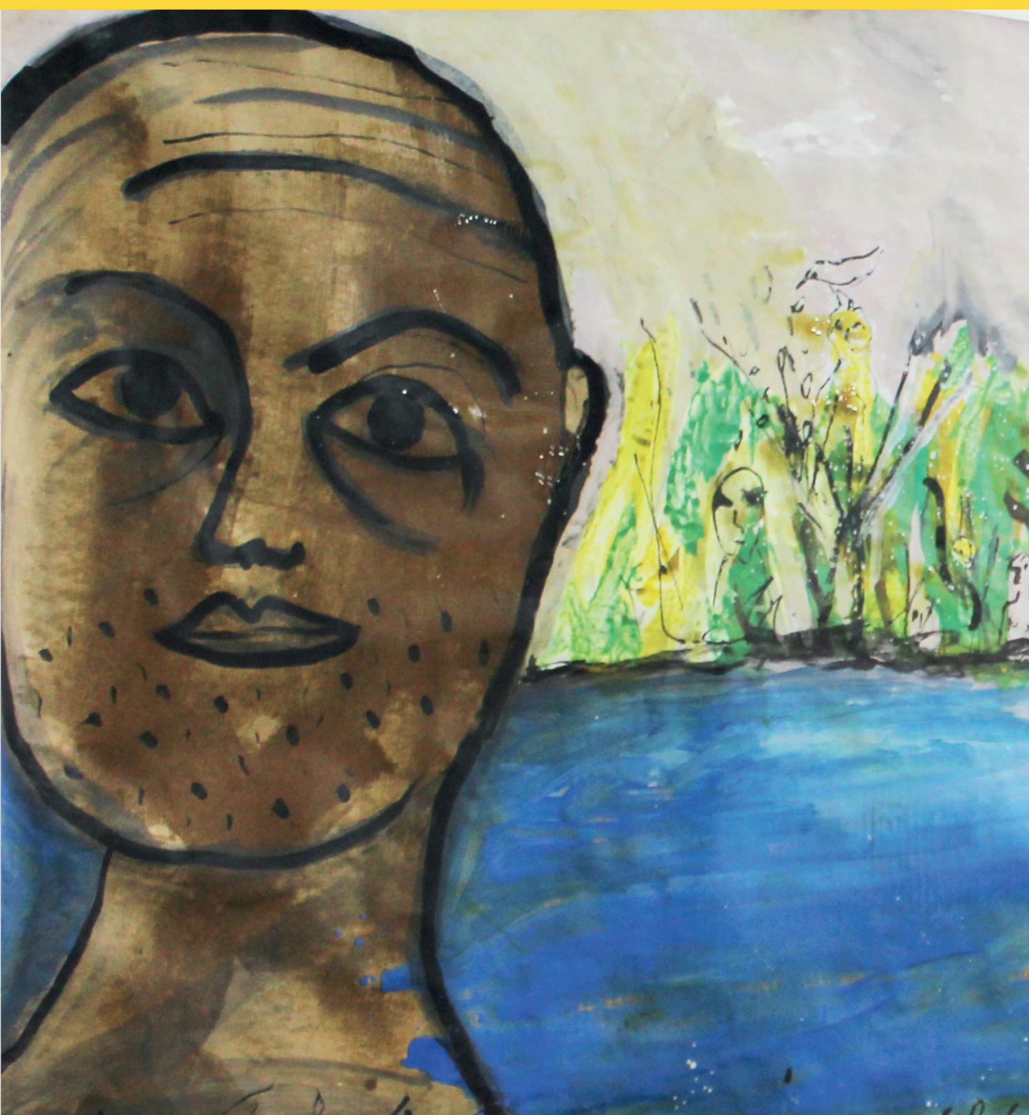
AGOSTINHO SANTOS Sem título, 2014 Óleo sobre papel. 100x435cm