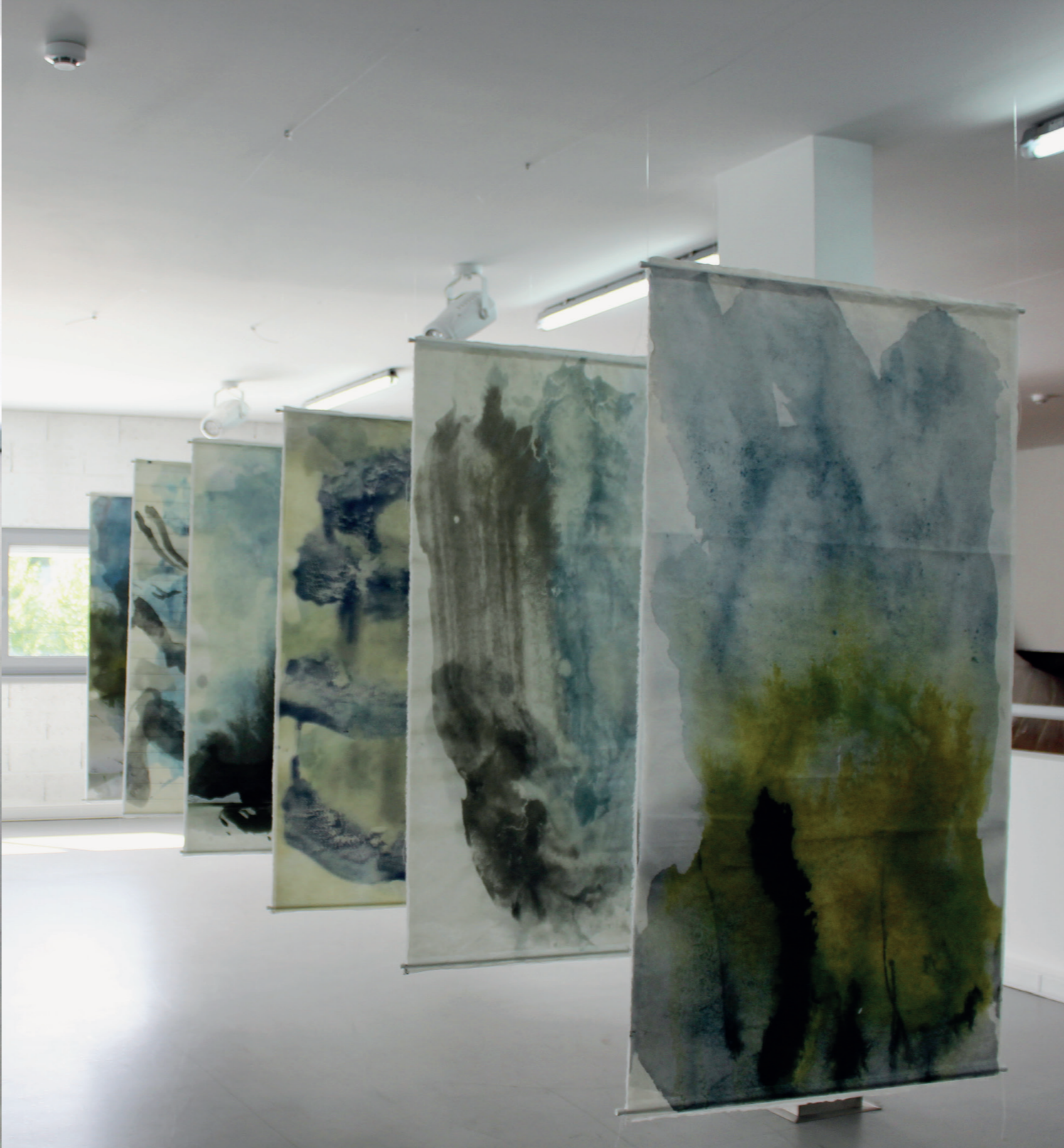
ENRIQUE MATÉ Sem título, 2014 Papel Japão. (6) 78x144cm