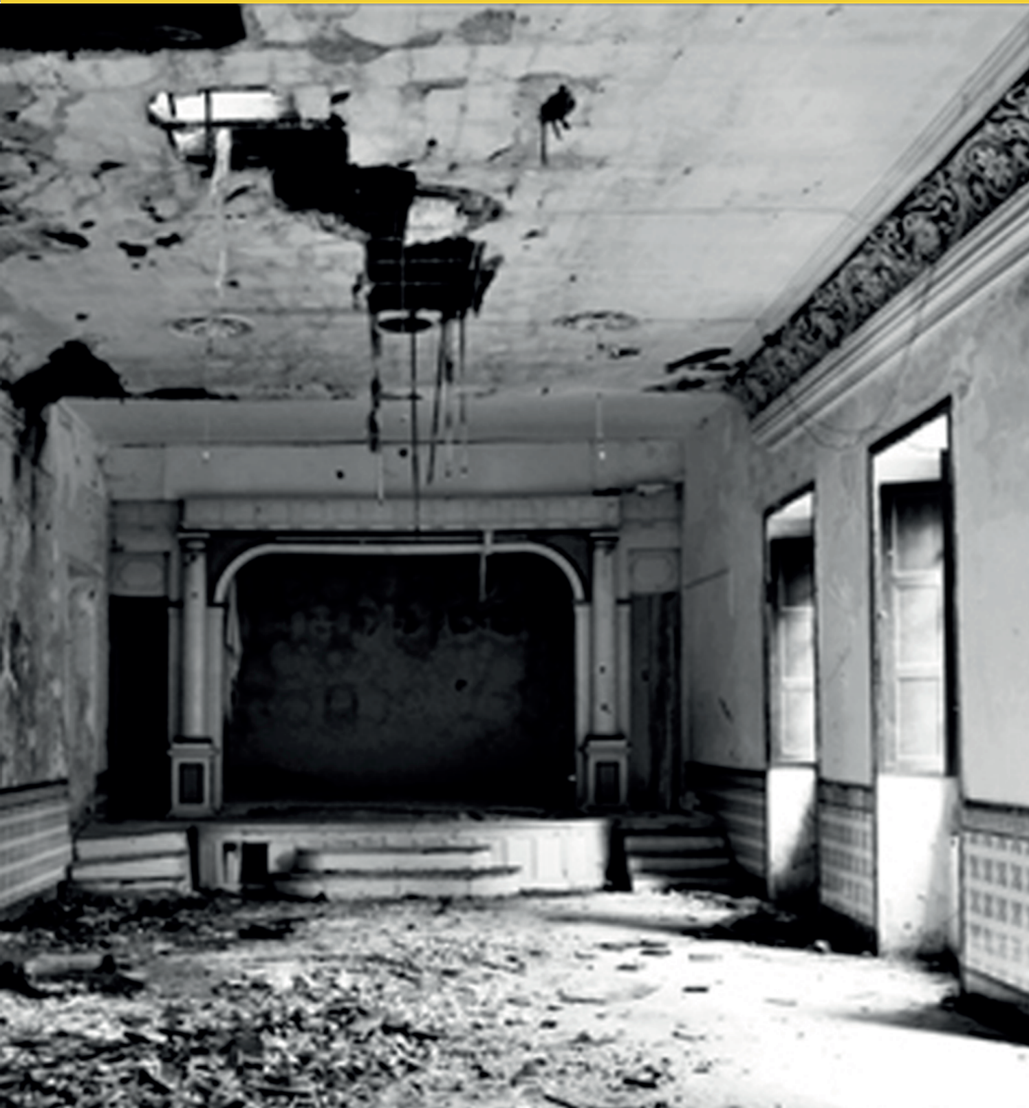
JOSÉ LUIS SUAREZ Espaços da Memória, 2014 Papel fotográfico Fujifilm. Dimensões variáveis.