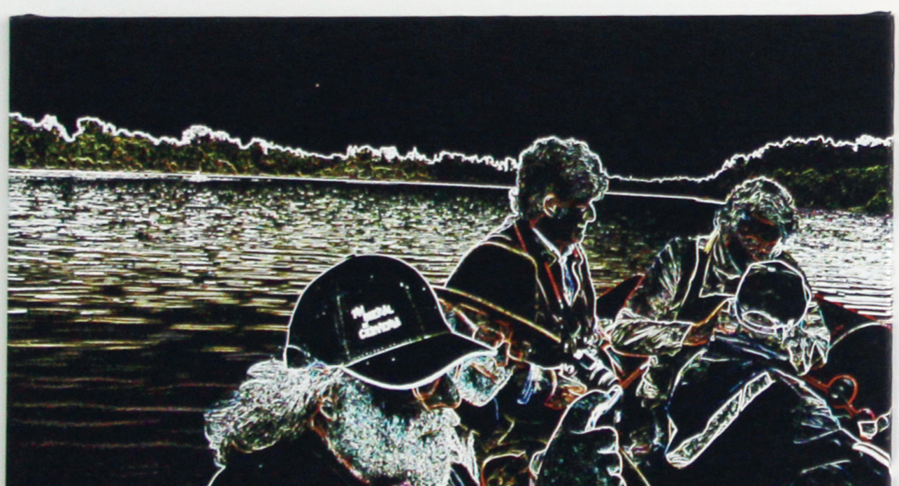
HENRIQUE SILVA Rio Minho, 2014 Imagens digitais impressas em tela em plotter. (5) 56x96cm; (1) 59x100cm.