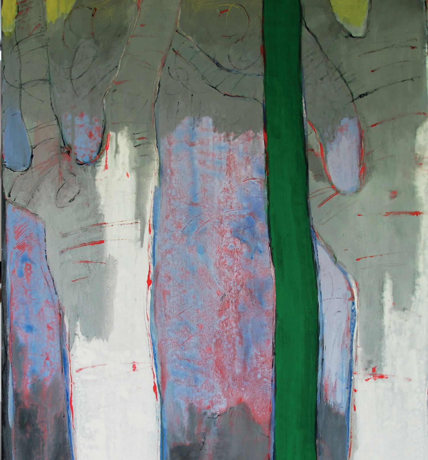
ANTON GOYANES Sem título, 2014 Acrílico sobre tela. (2) 62x150cm; (2) 82x123cm; 44,5x124cm.