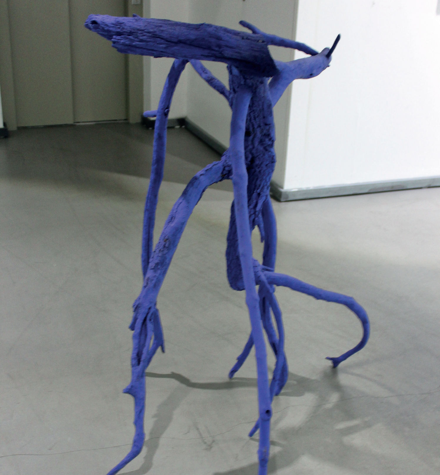
SILVÉRIO RIVAS Série: restos arqueológicos do Rio Miño, 2014 Madeira. Dimensões variáveis