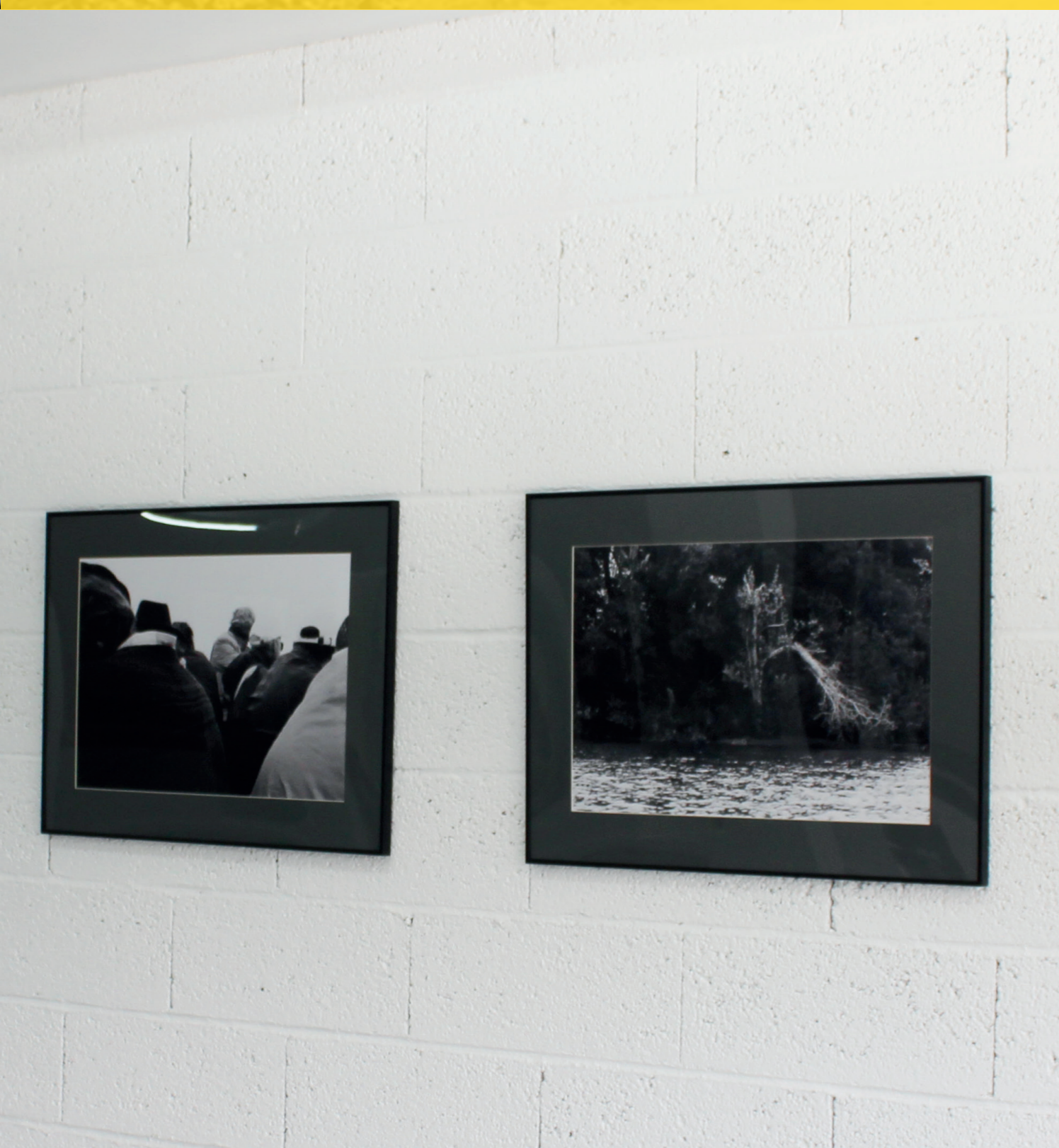
JORGE COELHO Sem título, 2014 Negativo analógico digitalizado com impressão digital. (6) 40x60cm; (1) 95x54cm